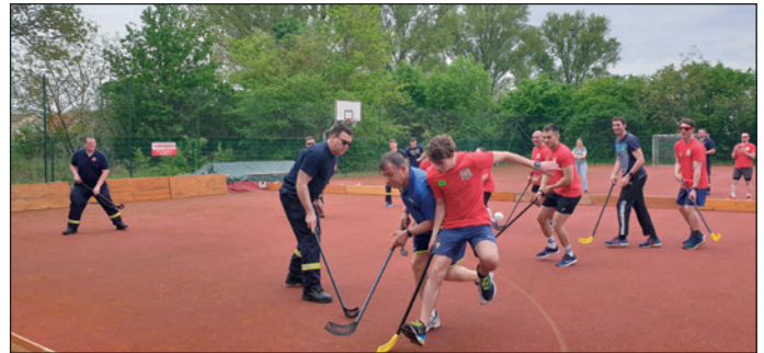
Gruppenbild Floorballspiel Feuerwehr Dannstadt-Schauernheim und Gäste Bèthény

beeindruckenden Headis-Kopfballspiel. Insgesamt war es ein überzeugendes Wochenende, das die deutsch-französische Freundschaft stärkte.