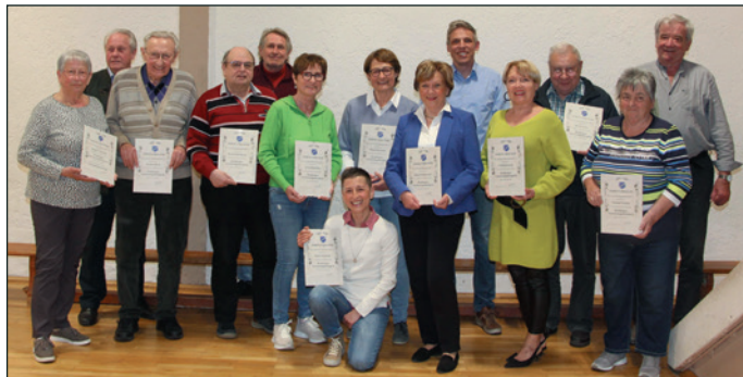
(Gemeinschaftsbild der Geehrten)