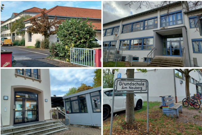
Die Fotos zeigen die vier Grundschulen, die im Krisenfall zu Leuchttürmen werden.

Bei einem Stromausfall von mehr als 30 Minuten fallen Telefon (Festnetz, Mobilfunknetze), Radio, TV, Internet aus. Im Not- und Katastrophenfall richtet unsere Feuerwehr Anlaufstellen für die Bevölkerung ein. Bürger können hier Notrufe absetzen. Zusätzlich werden an den Grundschulen „ Leuchttürme “ eingerichtet.